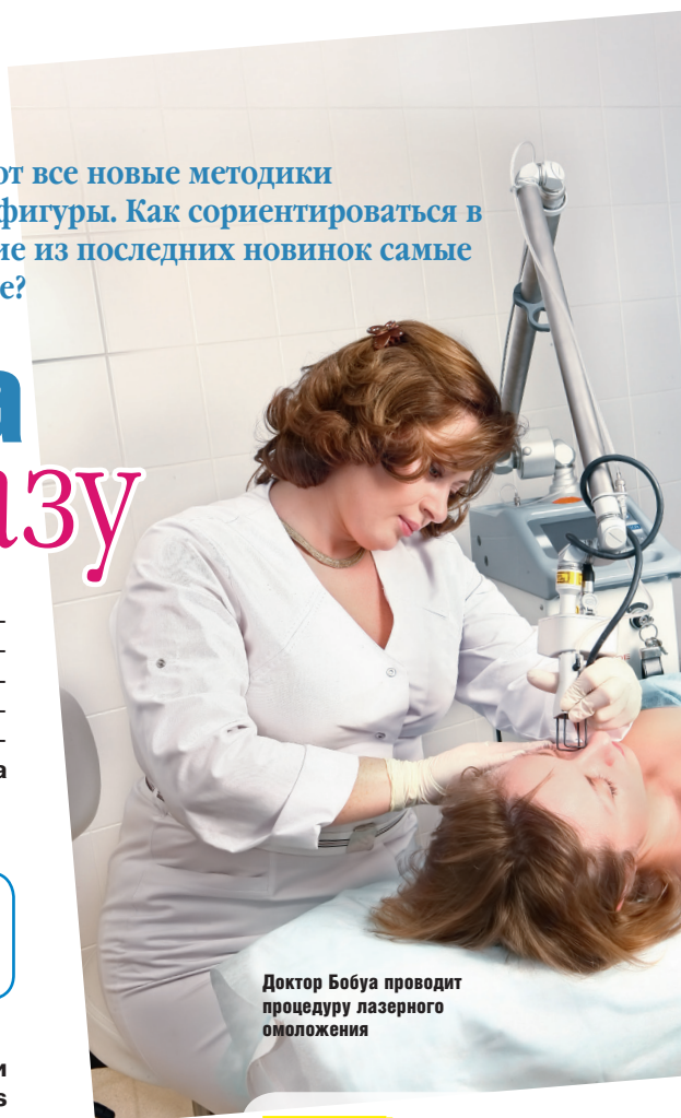
Доктор Бобуа проводит процедуру лазерного омоложения

Огорчают теряющий четкость овал лица, морщинки, «опущение» щечно-скуловой зоны, эффект «усталого» лица